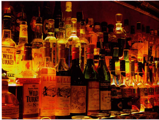
In Reih und Glied: Impression aus dem Mojito's im Hafen

Keine weitere x-beliebige After-Cinema-Location in einem Kinokomplex. Barchef und Inhaber Kent Steinbach ist einer der besten Barkeeper im Land und überrascht mit tollen Kreationen.